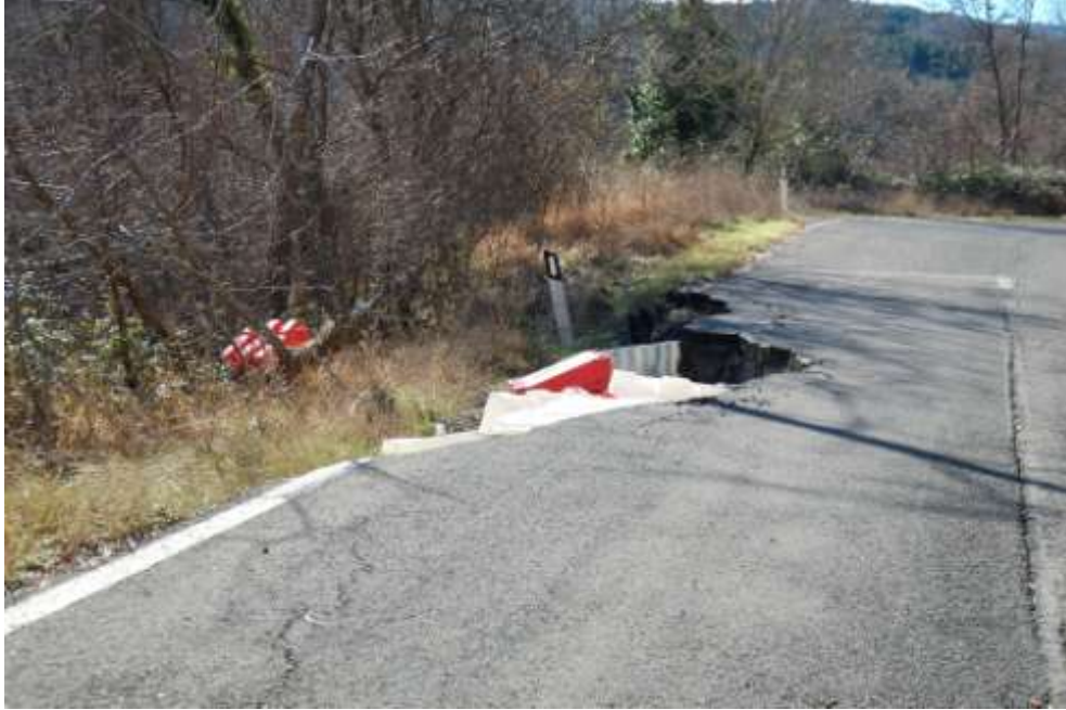
dissesto al Km 9+350

Al km 9+350 è presente un fenomeno franoso che interessa metà della corsia di valle