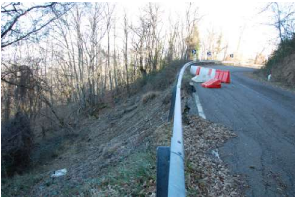
dissesto al Km 10+150

Al Km 10+150 si è verificata una frana che ha trascinato a valle la banchina stradale lasciando sospesa nel vuoto la barriera stradale e che sta minacciando anche la corsia di monte.