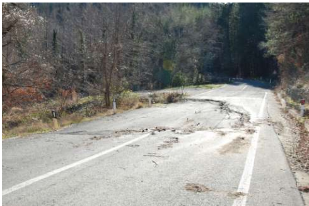
dissesto al Km 9+800

Al km 9+800 si è verificato un affossamento della quasi totalità della carreggiata,